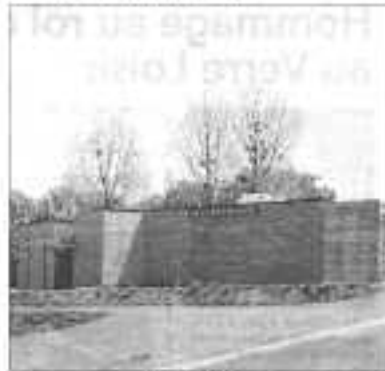
La nouvelle salle.

salle permettra le développement d'activités que les habitants de Glos recherchent, cette salle c'est un peu le cœur du village, un lieu d'échanges, de rassemblement, de fraternité et d'activités, c'est un lieu de vie. »