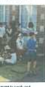
aut le week-end.