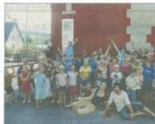
Faire voyager et découvrir les cultures étrangères aux enfants est le mot d'ordre du centre

Le but est de les faire voyager. On a organisé un British Day la semaine dernière, parents comme enfants ont adoré ! Une personne est venue bénévolement proposer des compétences en anglais et on avait réalisé plusieurs ateliers.