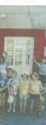
de la rue de Glo.