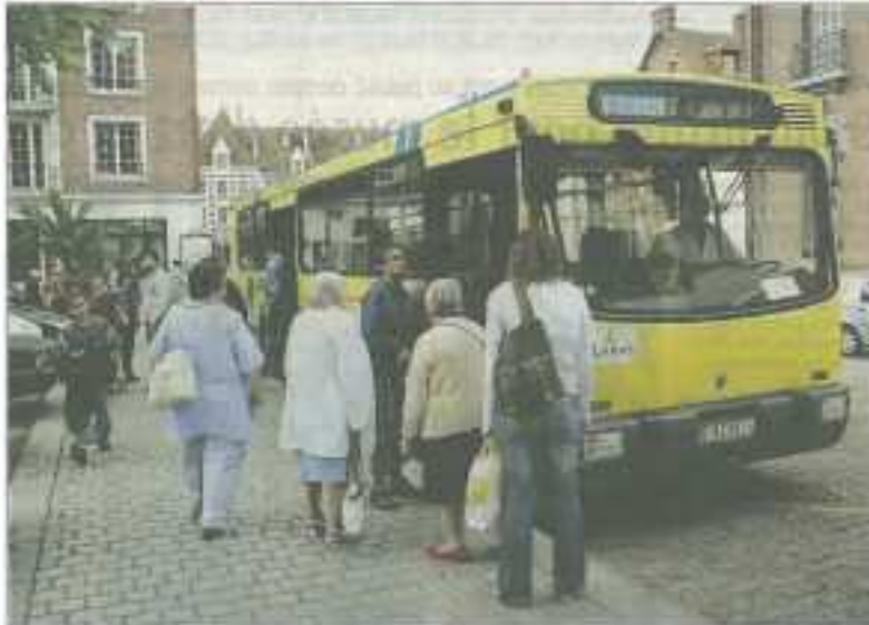
De septembre, une nouvelle ligne de bus sera créée. La ligne 7 ira de la place Mitterrand à la zone de la Galérie en desservant 11 arrêts.