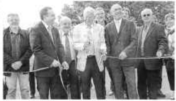
Une inauguration placée sous le signe de la jeunesse et de la musique