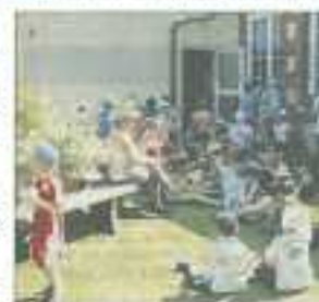
Les enfants profitent d'un goûter tous ensemble

Les inscriptions à la Journée se font à la mairie de Glos, tél : 02.31.62.70.43