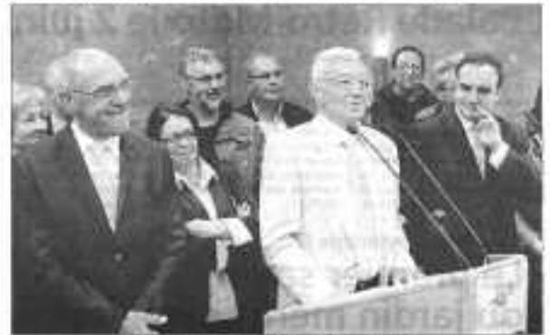
Le discours d'inauguration d'après par le maire.