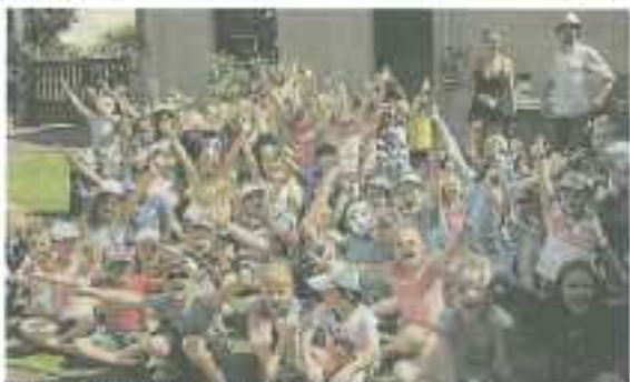
Ambiance carnaval au centre de loisirs de Glos.