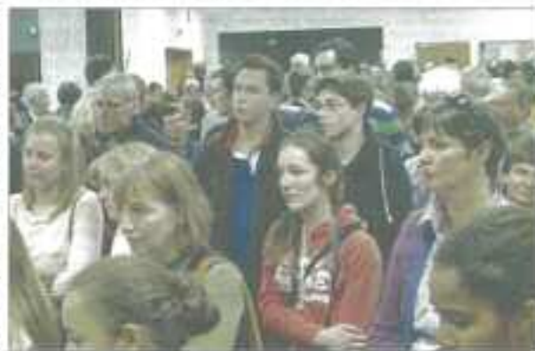
Plus de 400 Glosiens et Glosiennes ont assisté à cette inauguration.