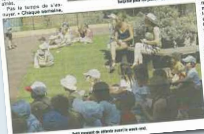
Petit moment de détente avant le week-end.

nous proposons une animation en rapport avec les continents, cette fois-ci, nous avons visité l'Amérique du Sud, la semaine prochaine ce sera l'Afrique, a précisé la directrice. Les petits ont fabriqué des masques de carnaval, des sombreros et des bracelets brésiliens.