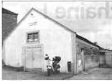
Le nouveau salle.

Plus de trois cents personnes ont assisté à l'inauguration de la salle polyvalente de Glos - les Sorbiers - dont la construction, pilotée par les habitants et les responsables des cinq associations, qui compte la commune, avait été votée par le conseil municipal le 29 mars 2012. Après avoir remercié le sous-préfet, Bernard Aubril, les autorités présentes et l'assistance rassemblée dans la salle, le maire Bernard Brouzet Douzaz a présidé cette réalisation lumineuse, avec une vue sur la salle, située sur la D206, à six cents mètres du groupe scolaire, à quelques encablures des maisons les plus proches. D'une superficie de 320 m 2 , la salle peut accueillir cent-cinquante personnes en espace repas, deux-cent-cinquante en aménagement théâtre et quatre cents debout. Une chaire mobile permettra d'en modifier la surface. Le montant total de cette réalisation dépasse le million d'euros.