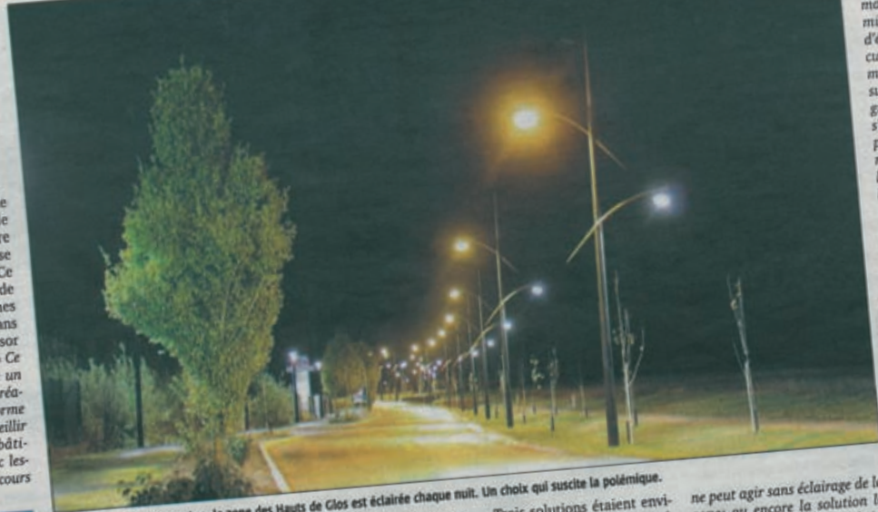
Depuis le mois de septembre, la zone des Hauts de Glos est éclairée chaque nuit. Un choix qui suscite la polémique.

Le communiqué rappelle que l'éclairage des Hauts de Glos n'est pas destiné à illuminer inutilement la zone mais à protéger ce qui se trouve en dessous : réseau électrique, fibre optique, distribution en eau po-