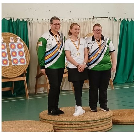
1 ère place pour l'ACPA