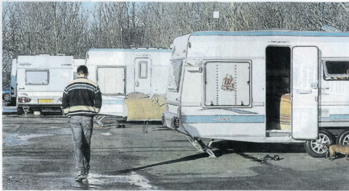
Sujet sensible depuis de nombreuses années, l'aire de grand passage pour les gens du voyage devait être créée à Lisieux. Il n'en sera finalement rien.

À la place du terrain de Lisieux, l'agglomération a proposé une alternative aux élus, ce jeudi soir. Un champ de 8 ha, situé à Glos, en dessous de la zone d'activités des Hauts-de-Glos. Ce terrain n'est pas nouveau : il fait partie des trois propositions présentées aux élus en 2022. Mais à l'époque, la proximité des nombreuses entreprises de la Zone d'aménagement concerté (ZAC)