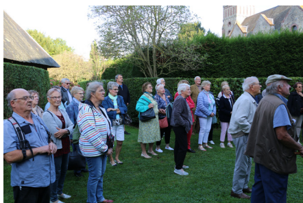
Voyage annuel du 19 septembre