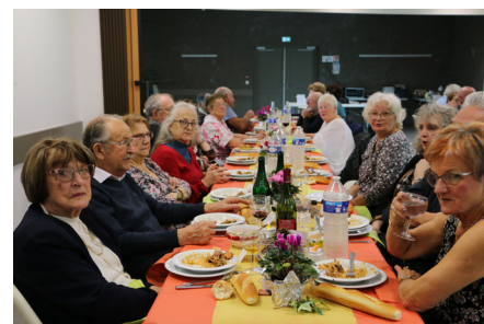
Repas du 13 octobre