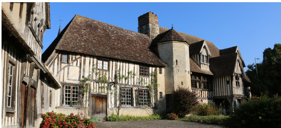
Voyage annuel du 19 septembre

Notre voyage annuel a eu lieu le jeudi 19 septembre 2024 à Honfleur et Plateau de Grâce en présence de 33 personnes. Ce voyage s'est déroulé sous un beau ciel bleu avec un départ de Glos à 7h 45 puis nous avons fait un premier arrêt au Clos St Gatien pour un petit déjeuner et ensuite nous avons visité le Manoir des Evêques à Canapville. En fin de matinée, nous avons effectué