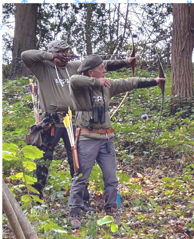
Les archers de parcours qui ont brillé lors des compétitions

Si vous souhaitez de plus amples informations, vous pouvez consulter notre site web à l'adresse https://www.acpa-lisieux.fr , notre blog à https://acpaysdauge.blogspot.com ou nous contacter par mail à l'adresse acpa.paysdauge@gmail.com