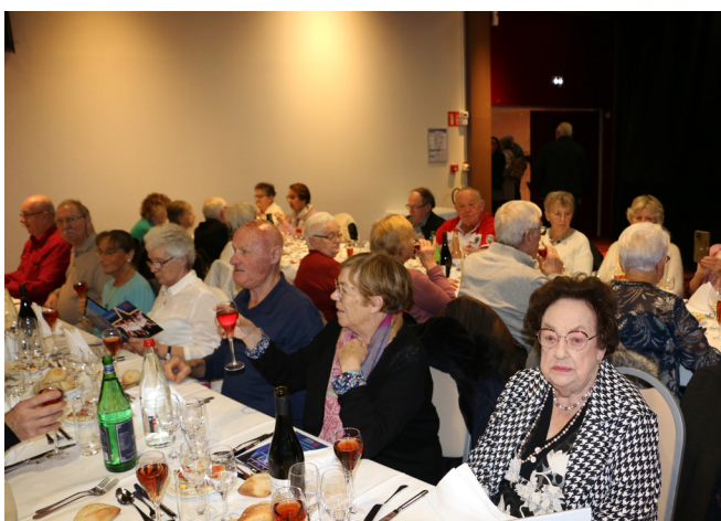
Cabaret spectacle au casino de Luc-sur-Mer, le 29 novembre