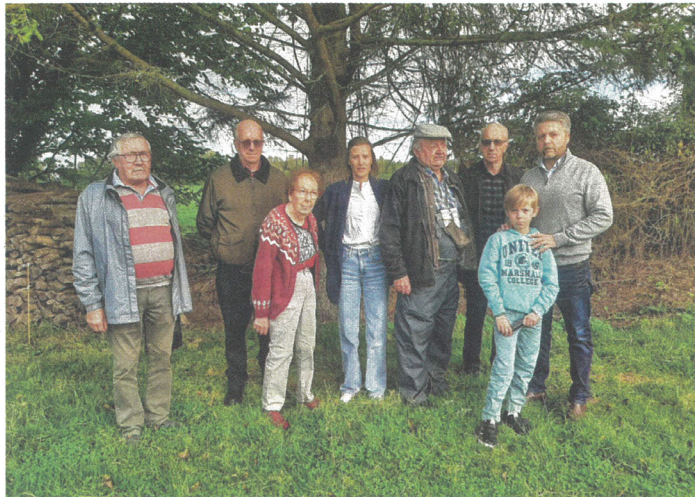
Des membres du collectif. Derrière, la parcelle sur laquelle l'agglo prévoit de créer l'aire de grands passages.

Ces habitants de Glos se sont réunis dans un collectif : « Pour l'instant, nous sommes au statut de collectif, parce que c'est le plus simple dans un premier temps. Mais si les choses durent, le collectif aura forcément vocation à se transformer en association. »