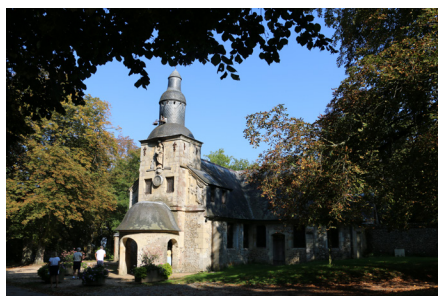
Voyage annuel du 19 septembre